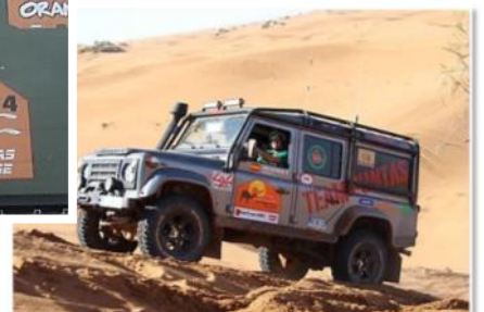
RALLYE SIN FRONTERAS CHALLENGE